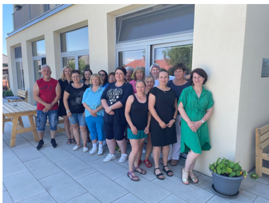
Dům klidného stáří sv. Anny v Sousedovicích

Za každou poskytnutou službou je konkrétní lidský příběh – situace, která není vždy jednoduchá, ale ve které může i drobná pomoc znamenat velkou změnu.